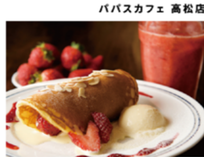
パバカフェ 高松店