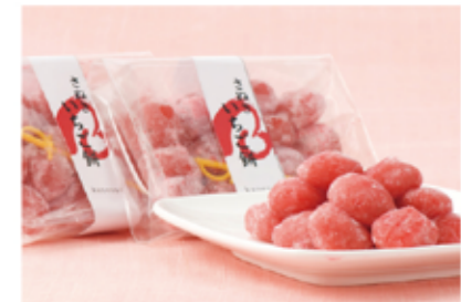
[参番街東館 1F] スイーツ

「唐きん」でおなじみのかねすえから春の新作が登場!お餅にいちごを練り込んだ「さめぎ いちご餅」1ケース ¥250