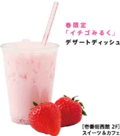
春限定 「イチゴみるく」 デザートディッシュ

ルピシアが参番街にオープン!! [参番街東館 1F] 世界のお茶専門店 世界のお茶専門店「ルピシア」オープン!旬を味わう紅茶・緑茶・烏龍茶などスタンダードなものから、オリジナルのフレーバードティー、ブレンドティーと、様々なお茶を年間400種類以上楽しめます。