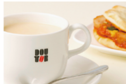
[参番街2号館 1F] カフェ

ロイヤルマサラチャイ S:¥320 M:¥370 L:¥420 カンツォーネ ローストチキン¥320 ※3/15-31、4/15-30は、売店商品10%offのお客様感謝デー!