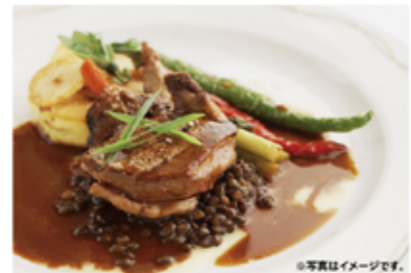
[参番街西館 4F] フランス料理

Buffet立食20名様¥5,000~ Courseランチ15名様 ¥5,000~ ディナー¥10,000~ ※お飲物付、貸切でご用意できます。詳しくはお問い合わせください。