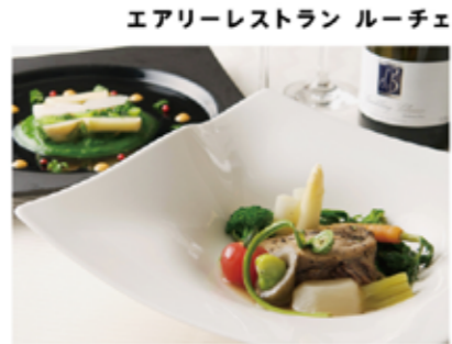
エアリーレストラン ルーチェ