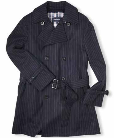
No.06 GINCHO & Fullhouse