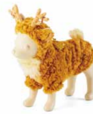
トナカイパーカー ¥2,800~