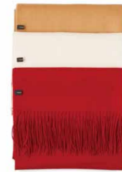
No.01 TOMORROWLAND [Ladies']