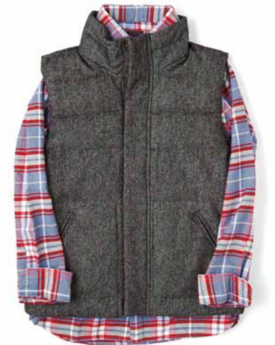
No.07 GAP / GAP Kids