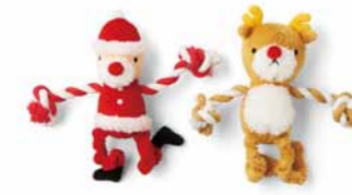
クリスマスツイ 各 ¥980