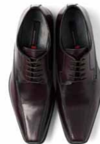
No.05 はるやま 高松店