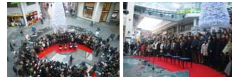
※イベントの日程等につきましては、変更になる場合があります。

<時間>14:00~歌唱指導 / 14:15~大合唱 <場所>高松丸亀町志番街前ドーム広場