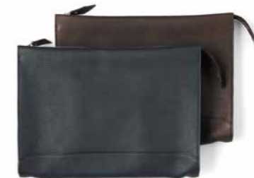
No.02 TOMORROWLAND [Men's]