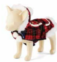
クリスマスチェックコート ¥3,000~