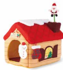
クリスマスデコハウス ¥7,800