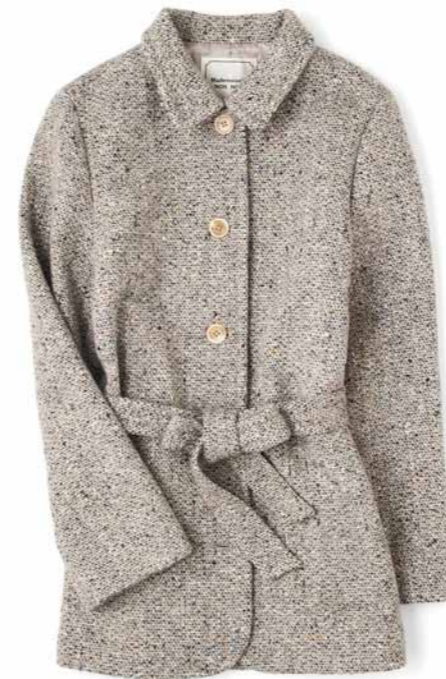
No.10 Mademoiselle NONNON