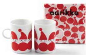
マグカップ&ペーパー ¥1,890・¥945