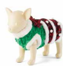
チェック柄ツリーワンピ ¥2,800~