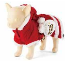
ガールズサンタワンピ ¥3,300~