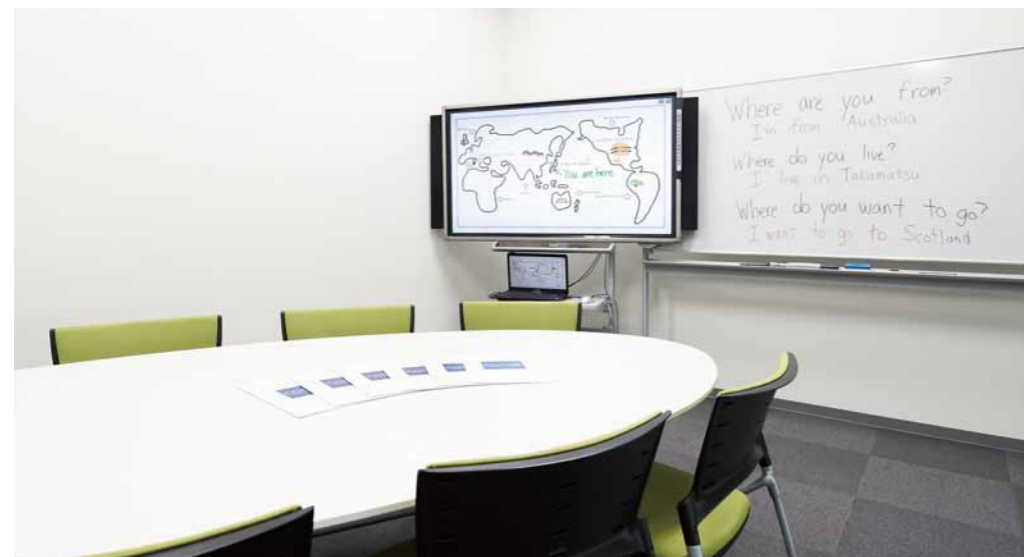
電子黒板で理解度がぐんとアップ!