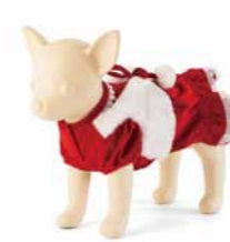
サンタボレロワンピ ¥3,000~