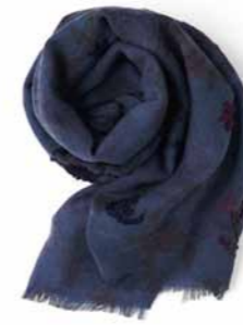
No.10 Mademoiselle NONNON