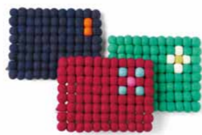
フェルトポット敷き ¥3,360