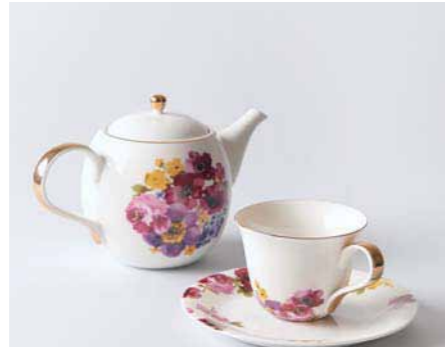
21. 新しいのに、どこか懐かしい雰囲気も。