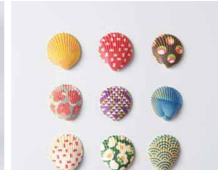
30. 鮮やかな色をまとった貝のマグネット。