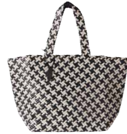
ゴートメッシュバッグ[大] ¥120,000 (価格は税抜き)