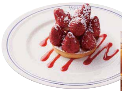
たっぷりトッピングされた10個のいちごが贅沢な「いちごのタルト」¥600 (価格は税抜き)

平日限定の日替わりサンドセット「サンドとスープのセット」¥1,000 (価格は税抜き)