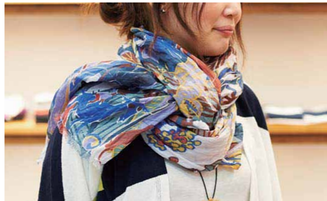
ストール ¥26,000 (価格は税抜き)