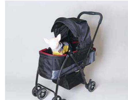
29. わが家の箱入り娘専用の特等席。