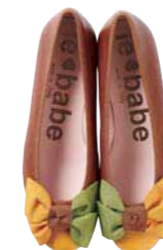
シューズ ¥20,000 (価格は税抜き)