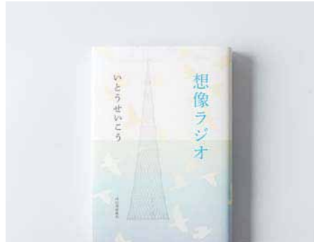
23. 第149回芥川賞候補作。