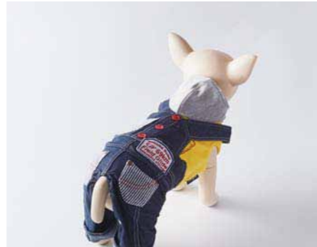
24. 愛くるしい、愛犬のうしろ姿