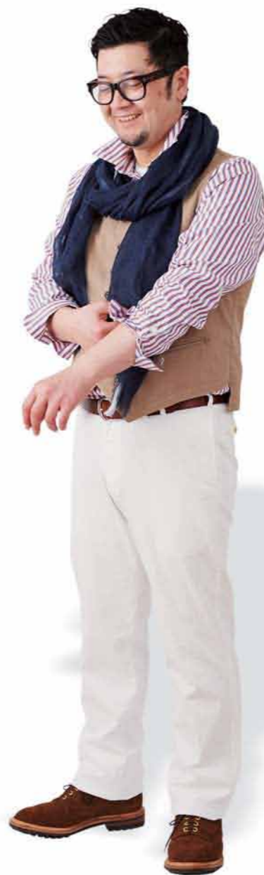
VEST + STOLE