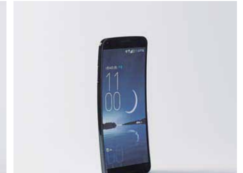
34. 常識を曲げる。世界が変わる。

17 Francfranc 貳番街3号館 1・2F たくさんのビー玉が詰まったようなかわいいフレグランスジェルは、3種類からセレクトして。ミニサイズなので、トイレや靴箱などの小さいスペースで使うのもおすすめ。/バラオ フレグランスジェル¥762 (価格は税抜き)