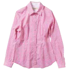
ギンガムブラウス