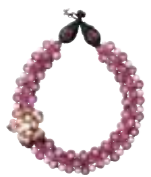
ビジュネックレス