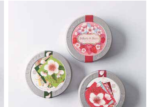
28. ティーカップのなかにも、春。