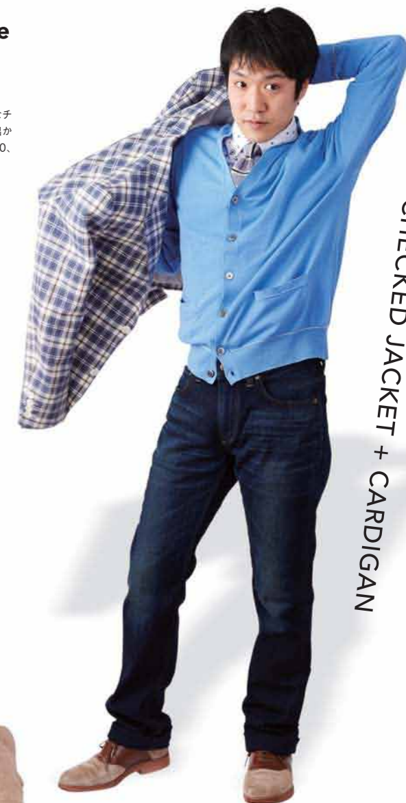
CHECKED JACKET + CARDIGAN