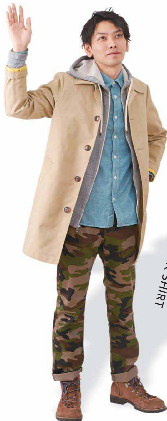
TRENCH COAT + WORK SHIRT