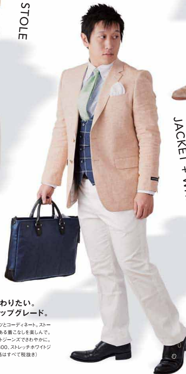
JACKET + WHITE PANTS