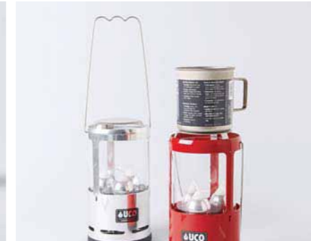
33. アウトドアにもかっこよさを。