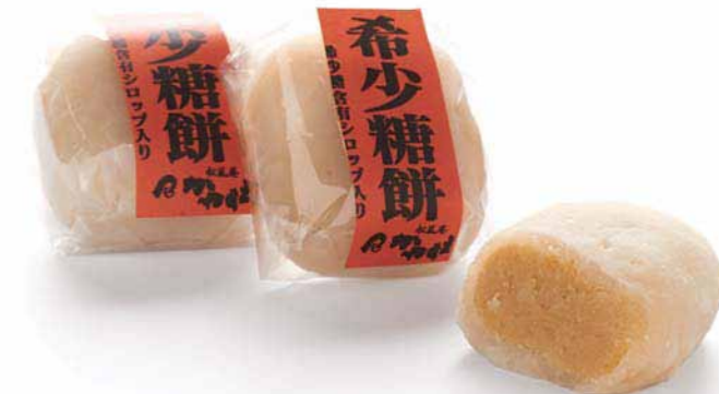
39: 松風庵 かねすえ 参番街東館 1F

香川県産の安納芋「弘法の夢」と希少糖含有シロップを使用した「希少糖もち」は、香川県産の原料にこだわった逸品。県外の人への土産としても喜ばれそう。※ハニーレモン5個(箱入り)をお買い上げの方に当店おすすめ商品をプレゼント。(2014/3/20~31まで) / 希少糖もち1個入り ¥143円 (価格は税抜き)