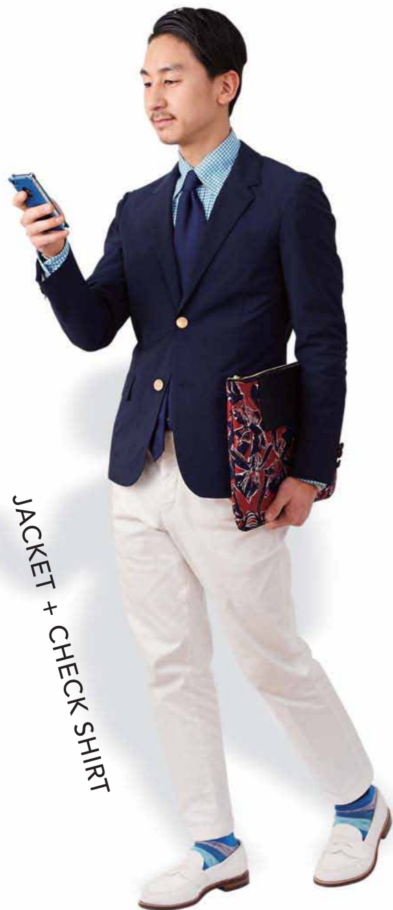
JACKET + CHECK SHIRT

シャツをベースにした、きれいめカジュアルなコーディネートがいっぱい。 ジャケットと合わせてビジネスに、ブーツと合わせてカジュアルに…。 コーディネートが楽しくなる春のメンズコレクション一挙公開!