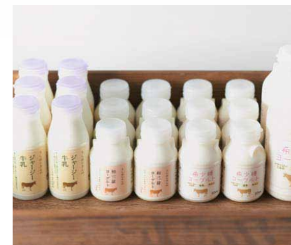
より安心を目指す大山牧場は、ジャージーの飼料を非遺伝子組換えに切り替えてのびのび育成。牧場直送のジャージーミルクのおいしさをたっぷり味わって。/ ジャージー牛乳 [200ml] ¥194、和三盆ヨーグルト [150ml] ¥204、希少糖ヨーグルト [150ml] ¥213、[500ml] ¥546 (価格はすべて税抜き)