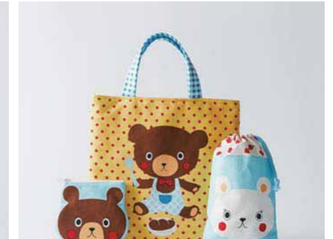
31. 愛くるしい表情に思わずにんまり。