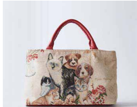
18. バッグにかわいいペットたちが大集合。