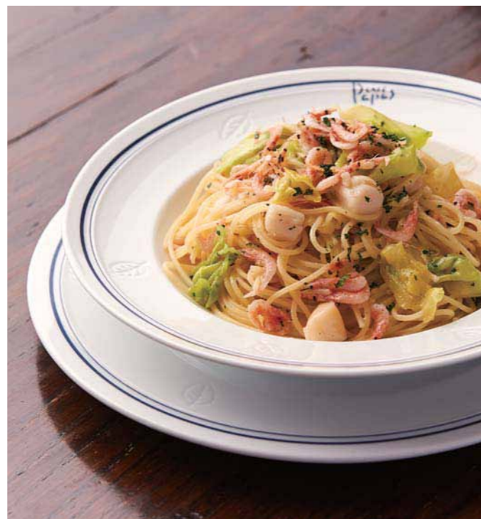
春だけの期間限定「桜エビと小柱と春キャベツの Pasta」¥1,300 (価格は税抜き)