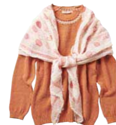
ニット ¥24,000、ストール ¥20,000 (価格はすべて税抜き)