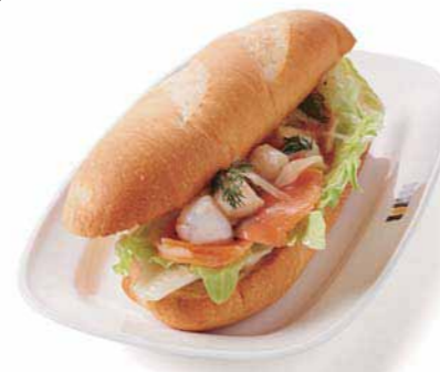
38: ドトルコーヒーショップ 高松丸亀町店 参番街2号館 1F