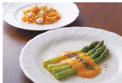
旬の野菜をたっぷりどうぞ。「香川県産アスパラの卵とトリュフの2色ソース」

今春17周年を迎えるズッカ。ワイン会などのイベントを企画中。平日のランチメニューには前菜と自家製パン付きの Pasta セット ¥935 (価格は税抜き) が新しく加わり、お急ぎの方でもご利用しやすくなりました。人気のランチはもちろん、大好評のアラカルトメニューも充実。