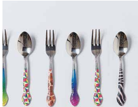
20. おいしい時間を彩るカトラリー。