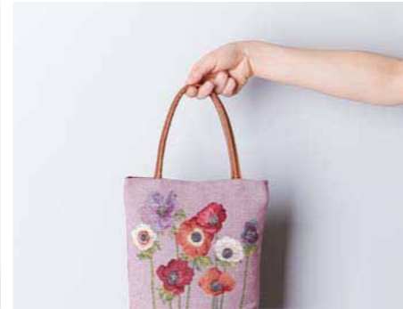
22. まるで本物の花を抱えているよう。