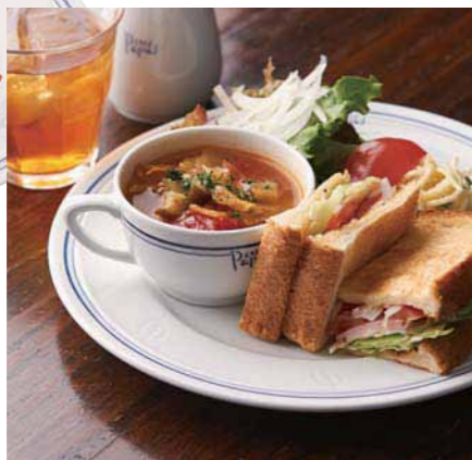
36: Papas CAFÉ 参番街西館 2F