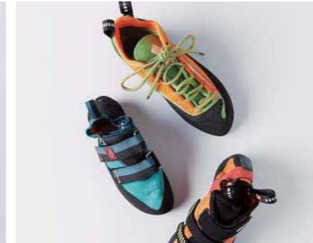
27. クライミングシューズの機能美