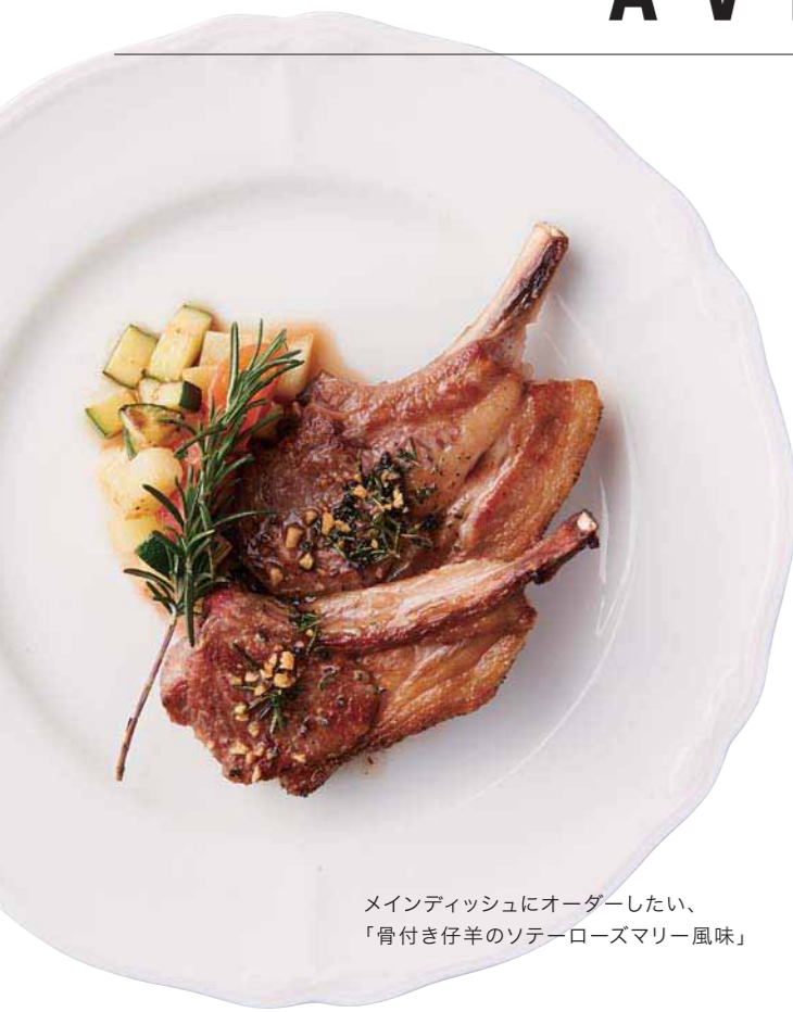
メインディッシュにオーダーしたい、「骨付き仔羊のソテーローズマリー風味」