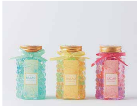
17. 見せて、飾って、いい香り♪