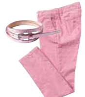
コットンパンツ(ベルト付き)