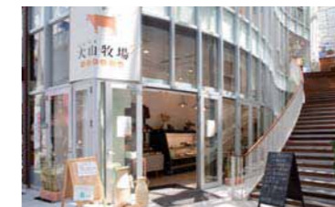
40: 大山牧場 うしおじさん 参番街2号館 1F