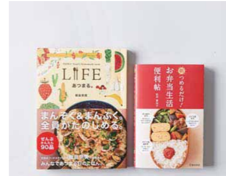
26. お弁当づくりが楽しくなる本