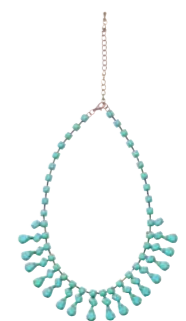
ネックレス ¥3,900 (価格は税抜き)