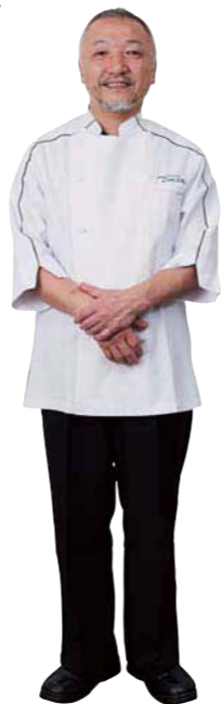
35: osteria Zucca 参番街西館 1F