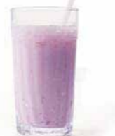
「ブルーベリーヨーグルト」S ¥320、M ¥370、L ¥420 (価格はすべて税込み) [4/1~ / S ¥340、M ¥390、L ¥440 (価格はすべて税込み)]

2/27に新発売の「サーモンと小柱の野菜マリネ」は、シャキシャキレタとスモークサーモンに、小柱・ニンジン・玉ねぎのマリネとディルハーブをトッピングしたさわやかな味わい。ドリンク付きのお得なミラノサンドセットにも加わったので、この機会にぜひ。/ミラノサンドB「サーモンと小柱の野菜マリネ」単品 ¥390、(ドリンク付き) S ¥560、M ¥610、L ¥660 (価格はすべて税込み) [4/1~ / 単品: ミラノサンド ¥410 (税込み) / セット: 全てのドリンク対象で合計金額より50円引き]