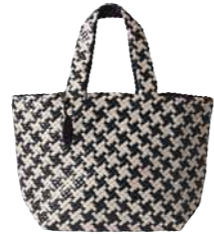
ゴートメッシュバッグ[小] ¥82,000 (価格は税抜き)