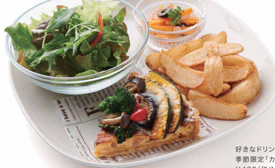
14時までのオーダーならドリンクとセットで。「キッシュプレートランチ」¥850 (税込み)