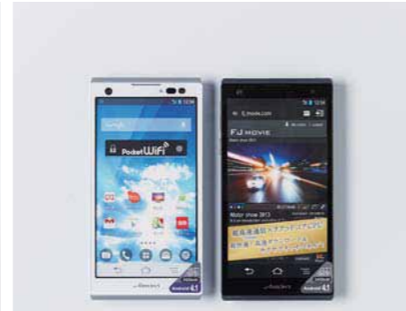
25. 長電話が楽しくなるスマホ。