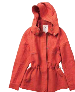
ジャケット ¥39,000 (価格は税抜き)