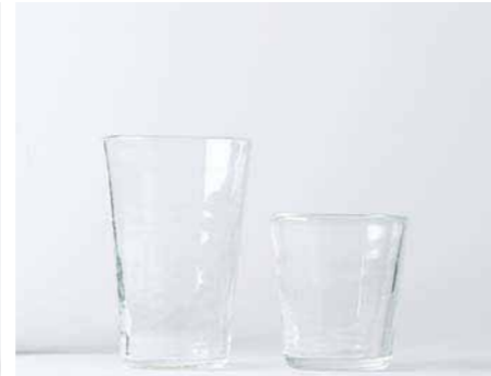
19. 春の予感を感じさせるグラス