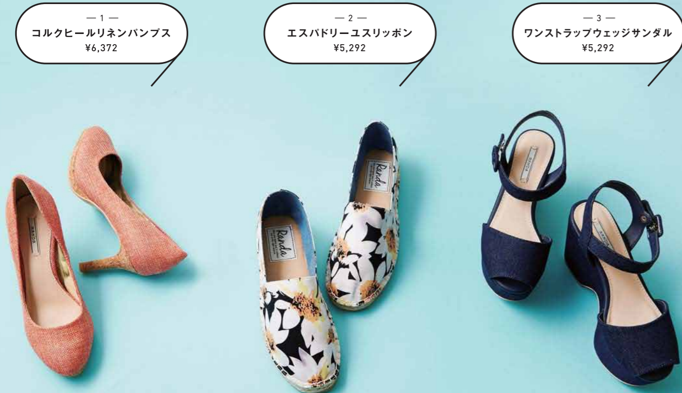
— 1 — コルクヒールリネンパンプス ¥6,372

1.コルクがちらりと見えて軽やかな印象。きちんとした着こなしにもカジュアルにもなじむパンプスは一足あれば便利。全6色。/2.一色だけのシンプルなものから、ボーダーや花柄など全7色。夏らしいコーディネートにぴったり。/3.足長効果抜群のウェッジサンダル。カラーバリエーションは12色。ストライプやシルバーなど個性的なものも。