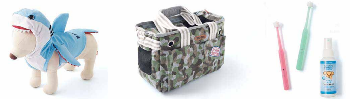
— 1 — サメなりきりアメリカ ¥3,240 - ¥4,104

1.わが家のゆるキャラ?毎年好評のサメなりきりがアメリカバージョンに進化して登場!ちっちゃなサメがお家で大暴れしちゃうかも...!/?2.収納ポケットがたくさんあるのでお出かけに大活躍間違いなし。トレンドのカモフラージュ柄もオシャレ。/3.わんちゃん専用の飲み水や歯ブラシなど、匂いに敏感なわんちゃんに配慮されています。