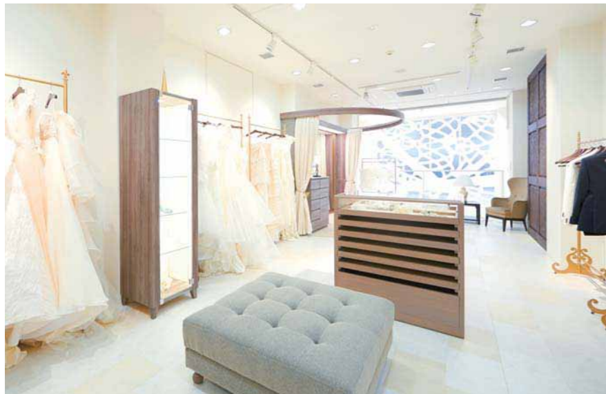
2Fはデザイナーズドレスと和装の1組貸し切りドレスフロア。ご試着の際には撮影することも可能です。